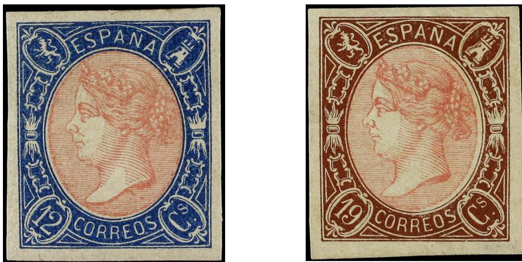
Afb. 3. De eerste daadwerkelijk tweekleurige uitgiften van Spanje

Verder zijn de zegels van de Quijote-serie monochroom, elk met zijn eigen kleur. Ook dat was tot dan toe gebruikelijk voor Spaanse zegels, zij het met enkele uitzonderingen. De zegels van de schildseries uit 1854 (Ed. 28-31) en 1855 (Ed. 35-38) combineren een zwart wapen met verschillende achtergrondkleuren. De series met koningin Isabel II van 1860, 1862 en 1864 zijn gedrukt op (niet-blank) papier, waarvan de kleur afwijkt van de kleur van de afbeelding zelf. En er zijn enkele uitgiften die daadwerkelijk meerkleurig genoemd kunnen worden: de 12 en de 19 cuartos uit 1865 (Ed. 70, 71; zie afbeelding 3 ), en hun getande evenknieën uit hetzelfde jaar (Ed. 76, 77).