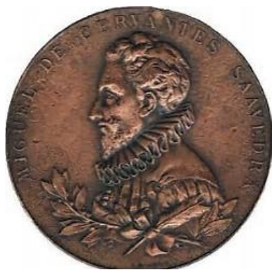
Afb. 2. Medaille ter herdenking van 300 jaar Don Quijote