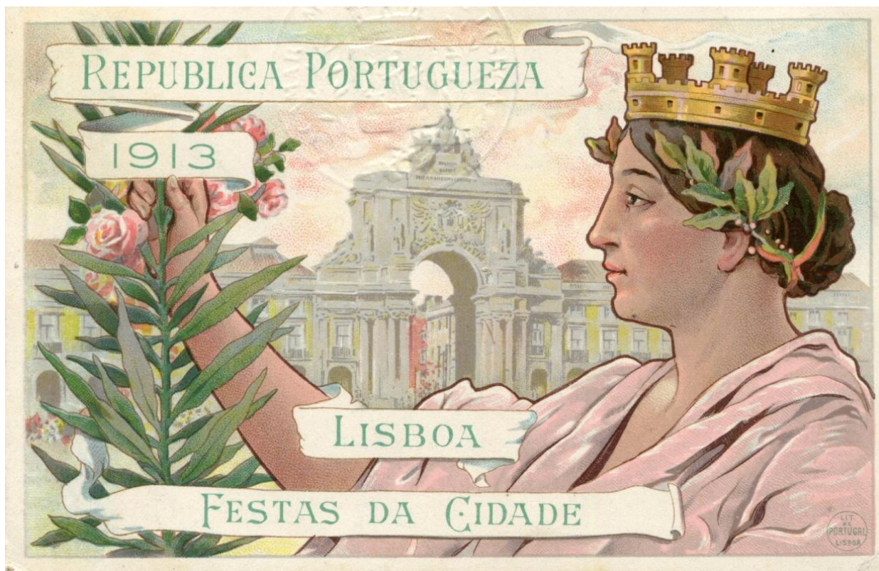
Voorzijde van de herdenkingsbriefkaart