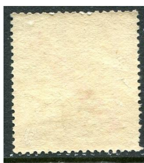
porcelana dun papier