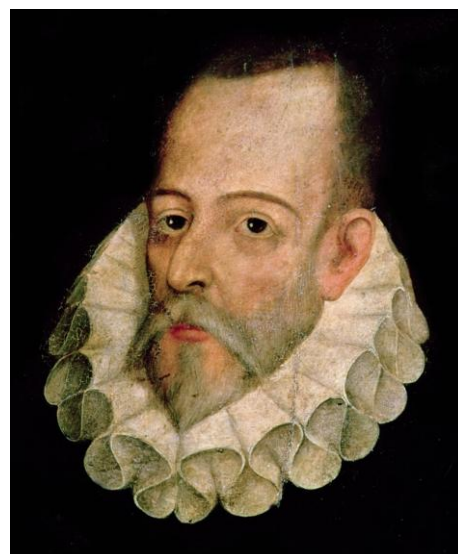
Cervantes 1547 - 1616

Miguel de Cervantes Saavedra (zie afbeelding), geboren op 29 september 1547 in Alcalá de Henares, vlak bij Madrid, brengt zijn jonge jaren door in het leger. Tijdens de zeeslag bij Lepanto tegen de Turkse vloot (1571), raakt hij zodanig gewond dat hij het gebruik van zijn linkerhand kwijt is. Hij brengt vervolgens nog eens vijf jaar door in gevangenschap in Algerije. Daar weet hij zijn medegevangenen te vermaken met vertellingen en geïmproviseerde theaterstukjes. Terug in Spanje voegt Cervantes zich weer bij het leger, nu als kwartiermeester. Onduidelijke financiële transacties leveren hem diverse malen celstraf op. Al die tijd, in en buiten de gevangenis, schrijft hij, met name toneelstukken en poëzie, vaak humoristisch van aard. Daar is helaas weinig van overgeleverd. Dan, in 1605,