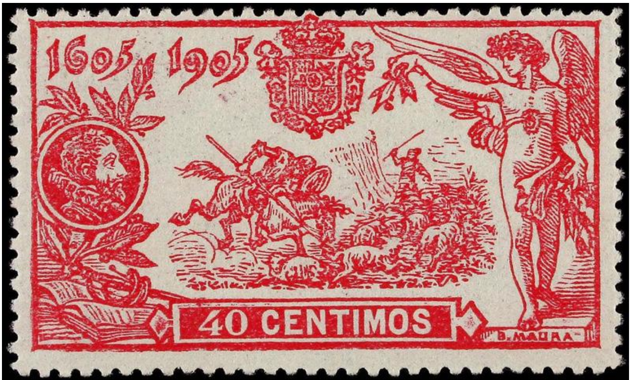
Afb. 4. Het zegel van 40 céntimos (Ed. 262)

De omvang van alle zegels is gelijk: 26 x 42 mm, en die van het kader 23 x 39 mm. Ze zijn uitgevoerd in lijntanding 14. Zoals de meeste Spaanse uitgaven van voor de tweede wereldoorlog zijn ook deze zegels veelal slecht gecentreerd, waarbij de perforatie nogal eens het zegelbeeld zelf aantast (zie de 1p en 4p in afbeelding 1). Aan de achterzijde bevindt zich, als vaker, een A-nummer, in blauwe inkt. De zegels werden gedrukt bij de Fabrica Nacional de Moneda y Timbre, de Staatsdrukkerij te Madrid. Ze zijn uitgevoerd volgens de boekdruktechniek, en gedrukt in vellen van 50 stuks, tweemaal 5 bij 5 zegels met daartussen een witte strook. Dat verklaart het bestaan van paren als in afbeelding 5.