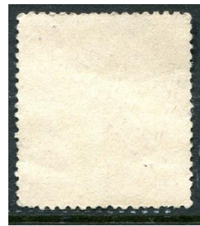
porcelana dik papier