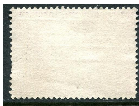
porcelana dik papier