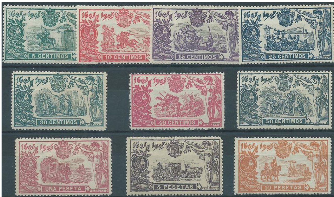
Afb. 1. De Quijote-serie van 1905