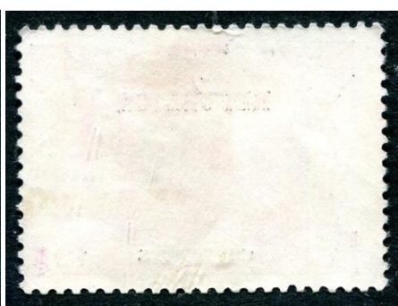
porcelana dun papier