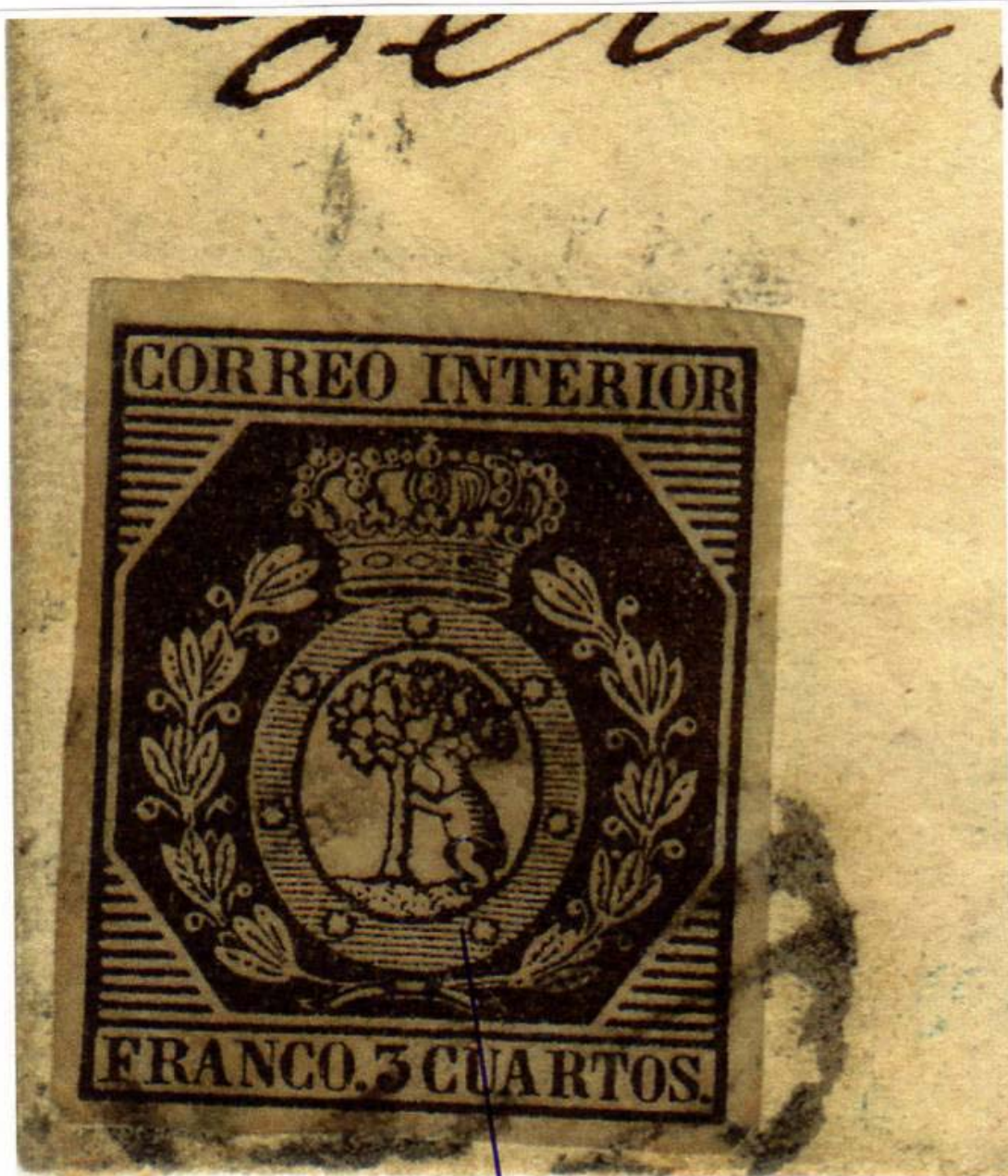
Lijn gedeeltelijk wel aanwezig!!