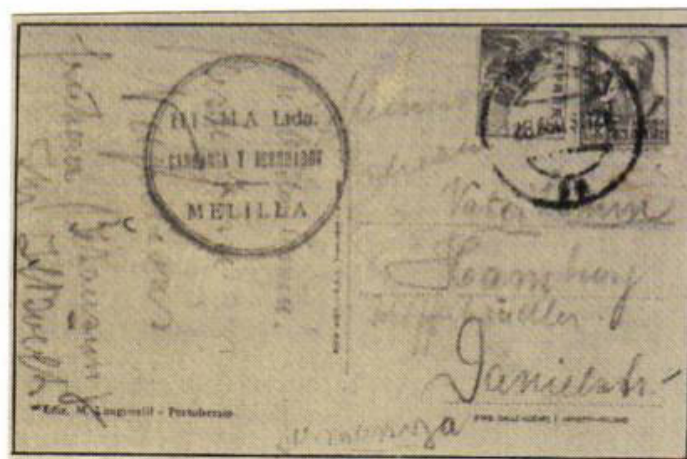
Briefkaart gelopen van Melilla naar Duitsland d.d. 28/8/37 met commercieel stempel H.I.S.M.A.