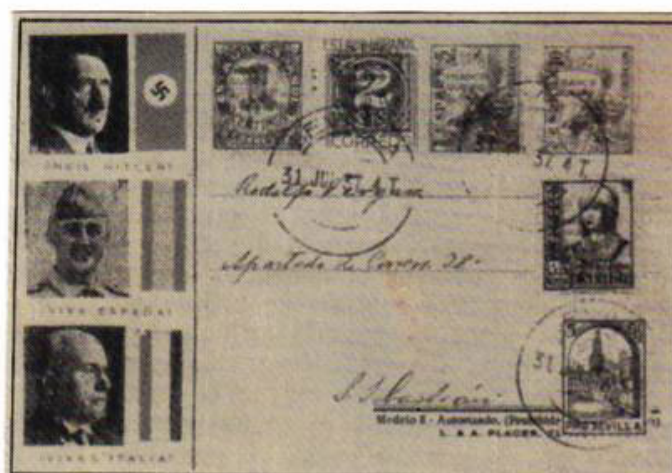
Propagandakaart met Hitler, Franco en Mussolini, naar San Sebastian. Stempel Sevilla 31/7/37