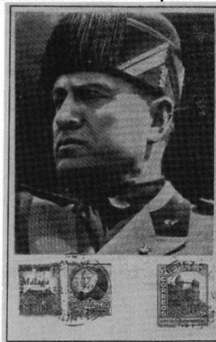
Briefkaart Mussolini. Gestempeld: Jerez de la Frontera 13/4/37.