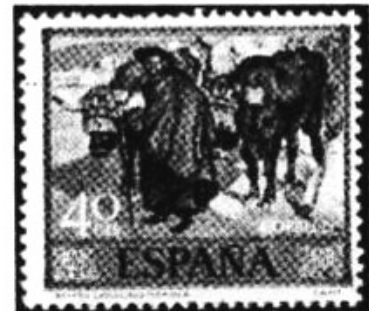
Een koeherderuit Castilië.