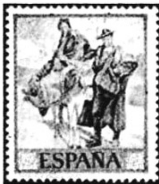
70 c. Typen uitde Mancha.80 c. Valenciaanse visverkoopster.