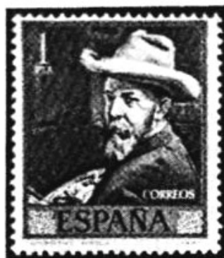
1 pts. Zelfportret.