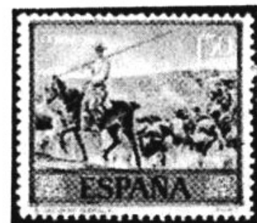
1,50 pts. Het inbrengen van de stieren.