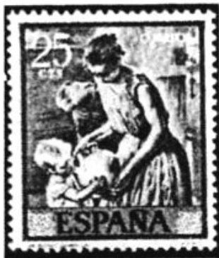
25 c. De waterkruik.40 c.